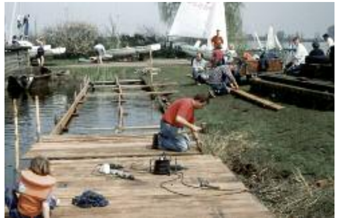
Erneuerung der Holzauflege der Optimisten-Plattform (1994)

03.07.1993 Feier des 25-jährigen Hafenjubiläums 12.-15.07.1993 Ausrichtung der Bestenermittlung der S-Kreuzer (19 teilnehmende Boote)