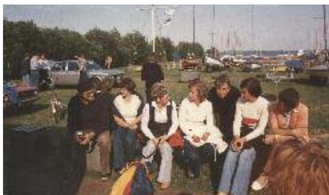
Deutsche Meisterschaft der 16qm Jollenkruzer 1979 auf dem Dümmer

08.06.2001 Die Blaue Flagge 2001 wird in Hamburg an den SCC überreicht