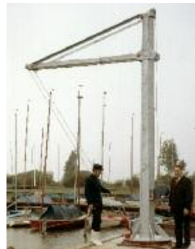
Die Krananlage noch mit Handkurbel (1970)

Ausrichtung der Internationalen DM für Tornados (37 teilnehmende Boote)