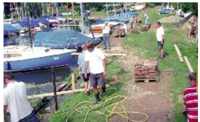
Instandsetzungsarbeiten im Hafen (2007)

27.12.2007 Der SCC feiert den 50. Jahrestag der Gründung