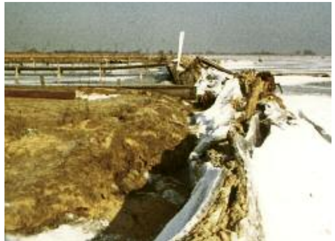
Die eingedrückte Spundwand im Winter 1970