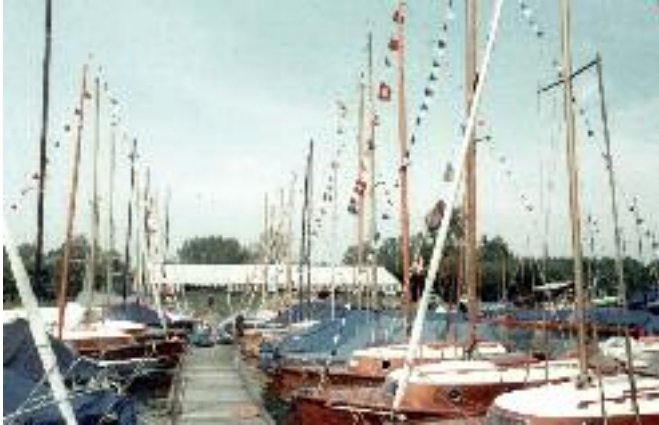
Feier des 25-jährigen Clubbestehens im Sommer (1983)

04.06.1983 Feierlichkeiten zum 25-jährigen Clubjubiläum