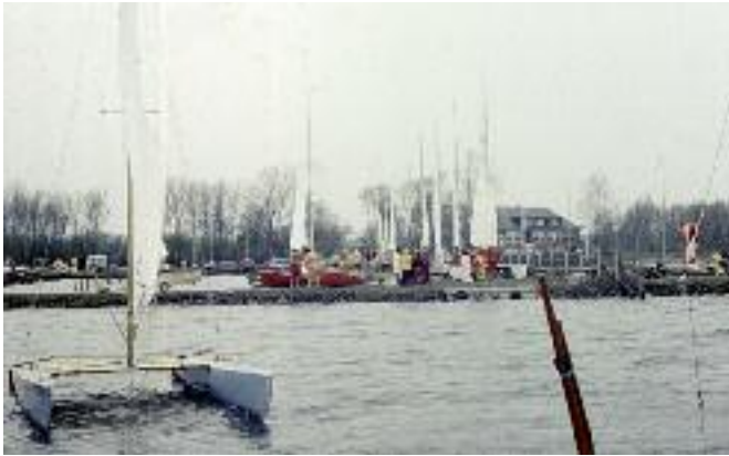
Dämmer Dobben für Zweirumpfboote (1974)