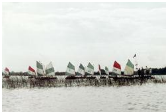
Die erste SCC-Optimisten-Wettfahrt vom Floß aus gestartet

14.05.1966 Taufe des ersten Jugendbootes Pirat G 2637