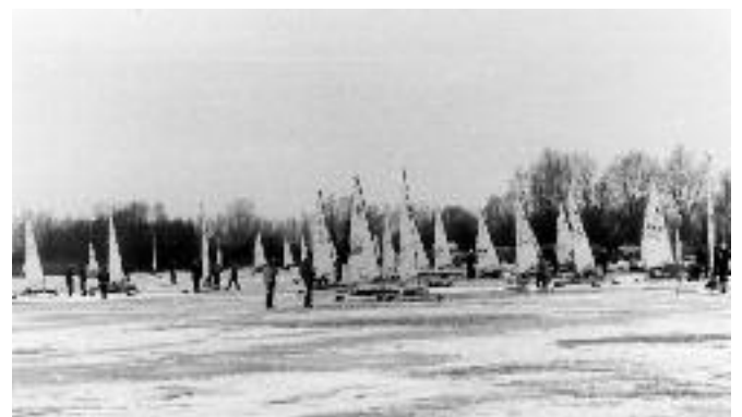
Deutsche Meisterschaft der DN-Eisschlitten (1983)

Ausrichtung der Internationalen DM für DN-Eisschlitten (61 teilnehmende Eisschlitten)