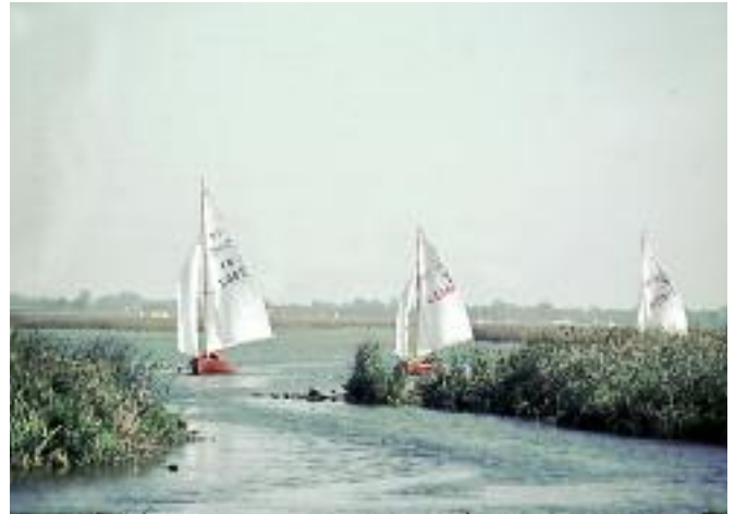
Einlaufen in den Hafen an der Deichschleuse

12.01.1964 Die Mitgliederversammlung beschließt die neue Satzung