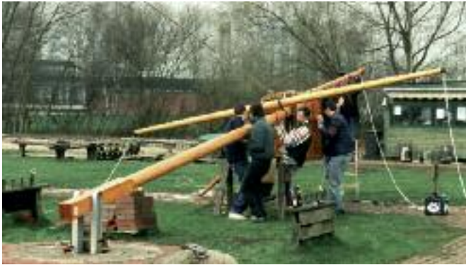
Aufstellen des neuen Flaggenmastes im Hafen (2000)